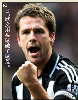
2日欧文用头球破了球荒。