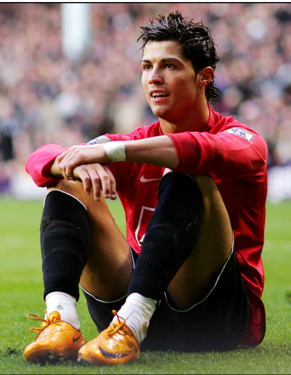
2月2日,C.罗纳尔多未能助曼联取胜(下图)。而阿德巴约打进2球(上图),不仅帮阿森纳反超曼联,而且还让自己的射手榜上只差小小罗1球。