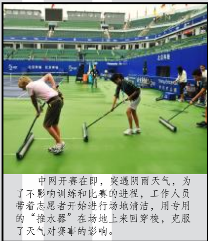
中网开赛在即，突遇阴雨天气，为了不影响训练和比赛的进程，工作人员带着志愿者开始进行场地清洁，用专用的“推水器”在场地上来回穿梭，克服了天气对赛事的影响。

中国网球公开赛开始之前，许多前期志愿者已经忙碌在中网的各个角落。他们为中国网球公开赛的前期准备作出了很大贡献。今天，我们有幸采访了一名前期志愿者，跟他一起回顾了中网的前期准备工作。