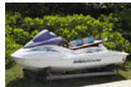
▲蜈支洲岛上的垃圾箱装扮成摩托艇的样子。