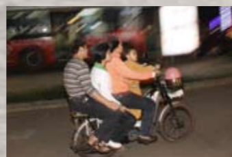
◀在海南，四人一辆的小摩托，在大街上经常能见到，这是为了省钱？省事？终究还是无视自己和他人的生命安全！

三亚恐怕是中国最适合开敞篷车的城市了，租辆车，到三亚有名的滨海大道椰梦长廊兜风去。沿着大道自南向北行驶，一路上听海浪拍打岸边的声音，呼吸清新的海风，移步换景地欣赏海景，好不惬意。大道一直通到三亚湾，从头到尾大约需要 30 分钟时间，沿途还有些海鲜排挡、度假村，累了可以吃点东西，尽情享受。 1. 亚龙湾的沙滩与酒店都不错，值得一逛。不用买票，沿着沙滩走就能进去了。亚龙湾的海滩就是漂亮。来三亚，你就是哪里都不去，每天就呆在这沙滩上，都不会吃亏。游泳、散步、在躺椅上晒太阳——舒服。看到吊床就玩一下吧，很不错的。如果喜欢步行，建议沿亚龙湾的沙滩，那份安静和惬意，就像漫步在自家的花园中。 2. 天涯海角、南山寺有时间可以去玩玩，别留下遗憾就是了，听说还有分界洲岛很不错，不过离三亚很远，回来要 3 个多小时，所以时间短的可以去。大小洞天就不要去了，去后真不知道看什么。当然酒店住腻了，海滩逛够了，选一两个景点看看也无妨，但就是一个不去的话也一点不可惜。 3. 推荐出海，感受渔民的生活，别有一番情趣。具体的事宜可以向当地渔民咨询。