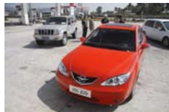
▲ 路上我们遇见了一对老夫妇，他们从北京花了半个多月，一路开车到海南，边走边玩很是潇洒。