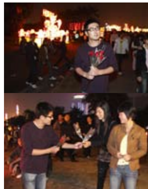
▲正月十五，我们在海口市见到了当地的“换花节”，当然也参与了一把，手捧玫瑰，寻找有缘人。