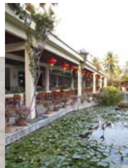
▲亚龙湾靠海的诸多五星级酒店是很值得逛一逛的，优雅的环境、洁白的沙滩、齐全的配套设施，游人并不多，很适合找个沙滩椅放松放松。