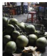
▼ 不尝尝这里的椰子，就不算到过海南。