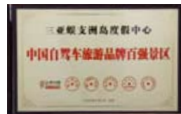
▲相信不久的将来，这类奖牌上也会出现《大众汽车·汽车旅行》的名字。