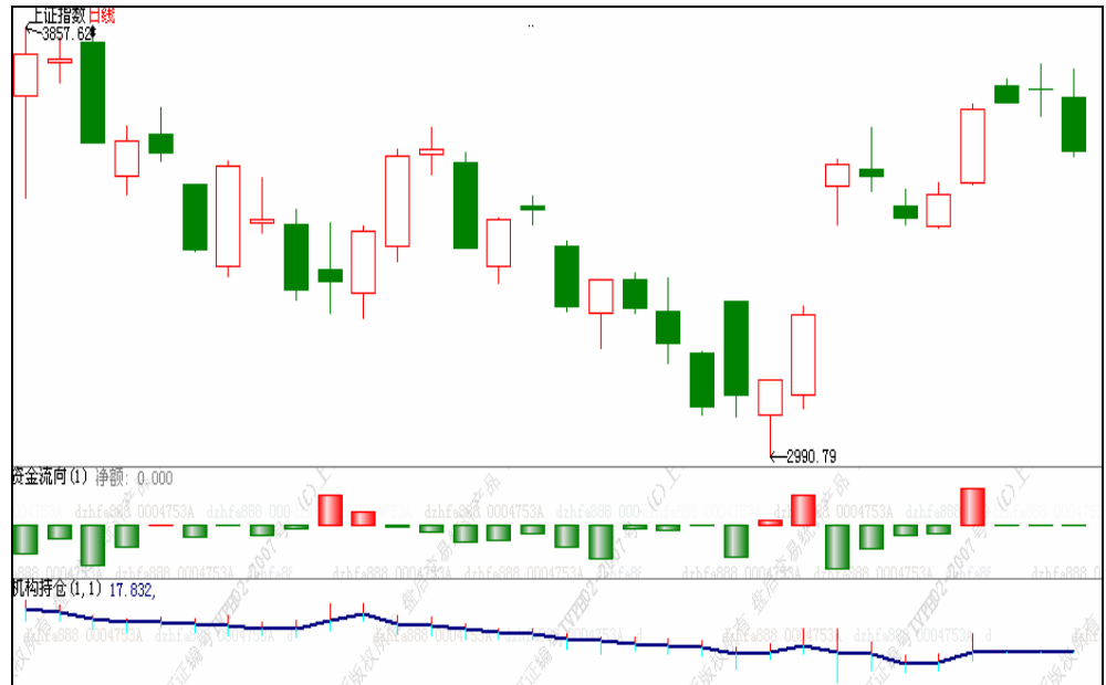
图1 近期上证指数走势与机构资金流向图